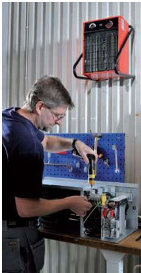
BX namontované na zdi (jenom BX 2 ÷ 15)

Termostaticky ovládaný motor ventilátoru